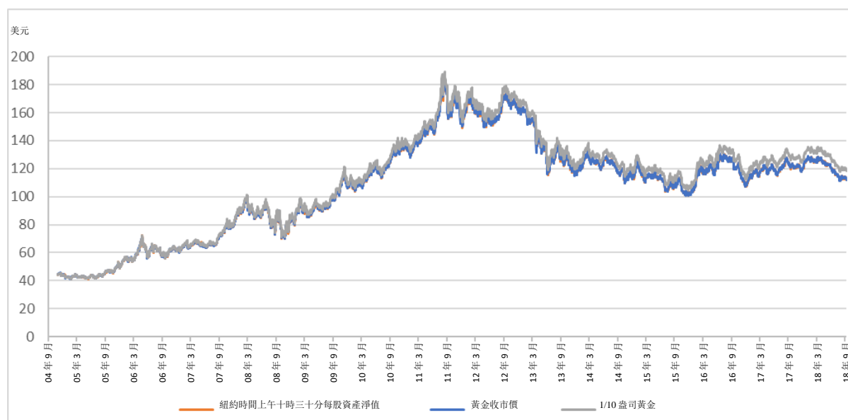
股價及資產淨值與金價比較圖 - 由 2004 年 11 月 18 日至 2018 年 9 月 30 日

下圖提供黃金價格的歷史背景。該圖闡明由2004年11月18日至2018年9月30日期間每盎司美元黃金價格的變動，並自2015年3月20日起以LBMA下午黃金價格為基準，而2015年3月20日前則以倫敦下午定價為基準。