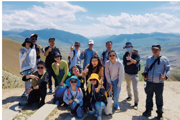
節日活動與團建旅遊