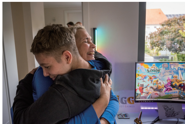
《王國紀元》為重病兒童達成心願