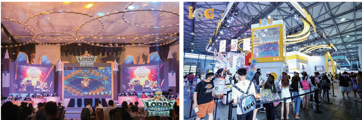
玩家互動活動現場

我們開展豐富多彩的活動與玩家互動，包括舉辦電子競技賽事、玩家聚會、及參加全球各大遊戲展等。玩家互動活動在擴大遊戲影響力的同時，促進了玩家與IGG之間的緊密聯繫，建立起網絡空間以外的交流社群。二零一九年《王國紀元》在全球15個地區舉辦了線下玩家見面會。近兩年受到疫情影響無法舉辦大型線下活動，我們逐步將玩家活動轉移到了線上舉辦，在全球範圍開展多場互動直播，深受玩家歡迎。疫情期間，除了以精品遊戲陪伴玩家渡過居家抗疫時光外，IGG及其旗下遊戲亦通過各大社交媒體平台或遊戲內的消息公告為玩家送上溫馨提示，提醒大家注意疫情防護，呼籲全球玩家共同抗擊疫情，保持身心健康。