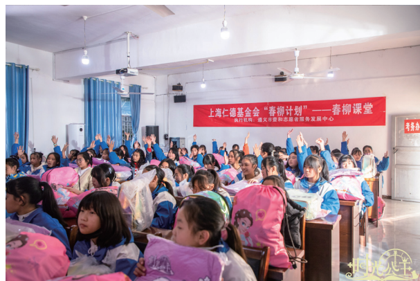
《時光公主》關懷留守女孩