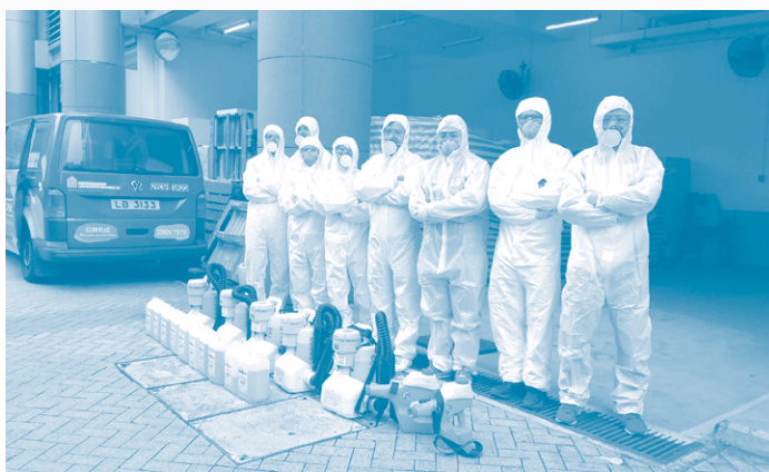
本集團定期進行噴霧消毒