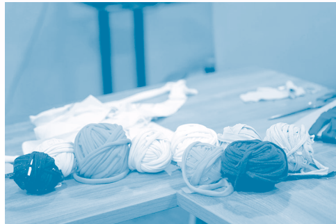
於二零二一年五月的改造工作坊