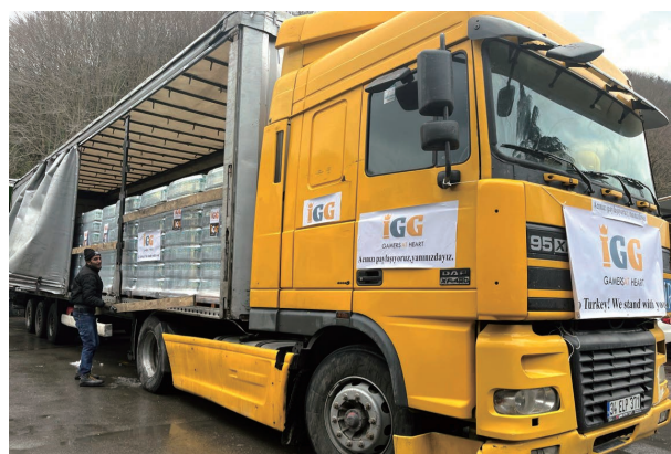
為地震災區捐贈救援物資