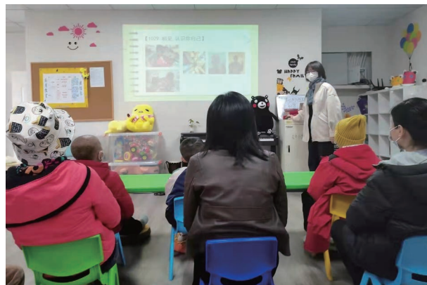
「病房教室」關愛白血病患兒