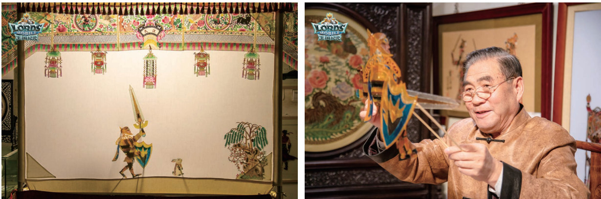
在遊戲中融入傳統文化元素

我們為員工自發組建的公益社群提供活動平台，定期舉行公益志願者活動，例如義賣等活動，通過跳蚤市場、銷售土特產品等方式為需要幫助的群體籌集善款。