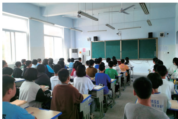
重建後的中國河南衛輝市第十中學教學樓