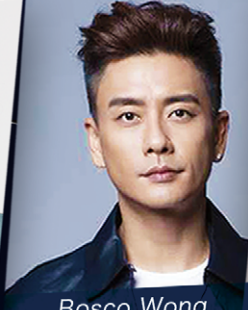
Bosco Wong 黃宗澤