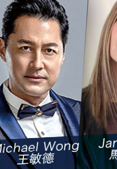
Michael Wong 王敏德