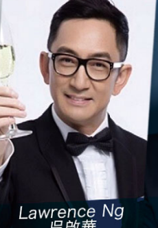
Lawrence Ng 吳啟華