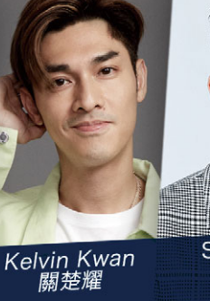
Kelvin Kwan 關楚耀