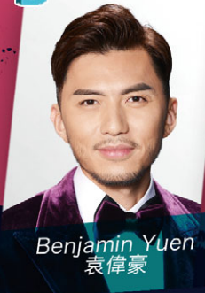
Benjamin Yuen 袁偉豪