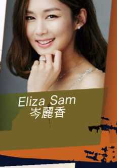
Eliza Sam 岑麗香