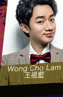
Wong Cho Lam 王祖藍