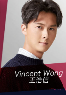
Vincent Wong 王浩信