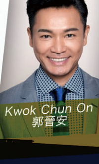
Kwok Chun On 郭晉安