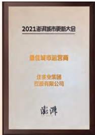
2021最佳城市運營商 澎湃新聞