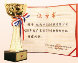
2020年度廣東 扶貧濟困紅棉杯金杯 中共廣東省委農村工作 領導小組