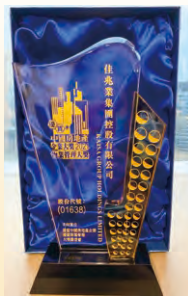
2021年度優質中國 房地產企業大獎 優質中國房地產企業及 優質物業管理大獎籌委會 (香港股票分析師協會)