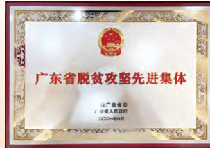
廣東省脫貧攻堅 先進集體 中共廣東省委廣東省 人民政府