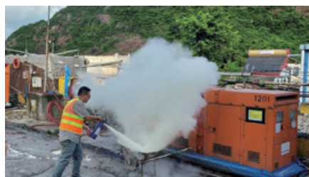
在項目地盤進行消防演習

根據本集團的工作指引所述的消防安排，至少須每六個月進行一次消防演習。於每次演習後，各責任方須召開全體會議，以對各方面進行檢討，並在必要時制定改進計劃。