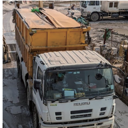
配備機械頂蓋的泥頭車