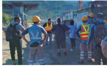
在項目地盤進行安全培訓

我們會確保所有地盤工人均須接受強制性基本安全培訓（平安卡）。我們亦提供定期施工現場健康及安全培訓，包括安全入職培訓、工地座談會和由安全主任設計的特定健康及安全培訓。