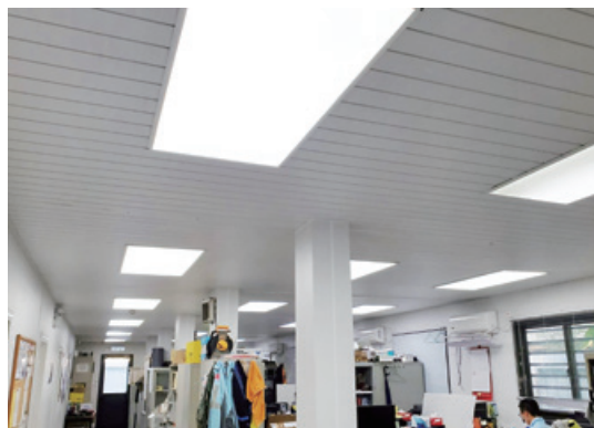
工地辦公室安裝節能燈具 (LED燈)