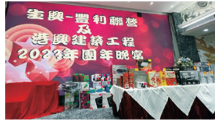
團年晚宴的幸運抽獎