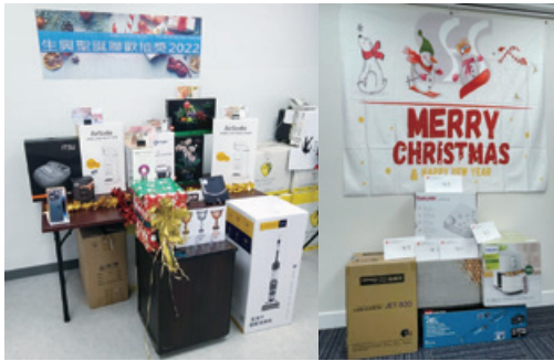
聖誕派對的幸運抽獎

由於於報告期間新冠病毒肆虐，本集團已限制其僱員活動以降低病毒傳播的風險。鑒於將實施適當的新冠病毒預防措施作為優先事項，我們組織了豐富多彩的活動以激勵及感謝僱員的努力和付出，僱員活動包括聖誕聯歡會及團年晚宴。