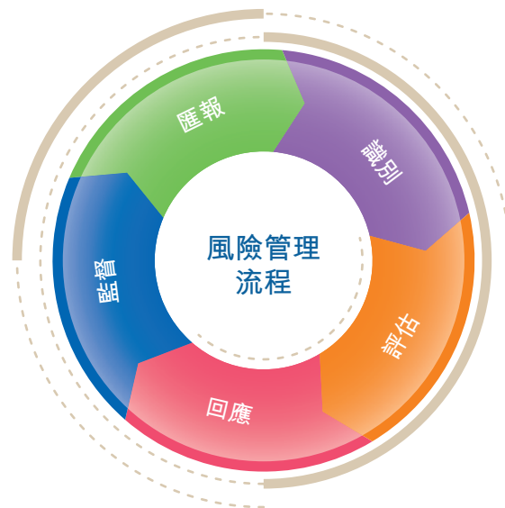
（圖一：風險管理流程）