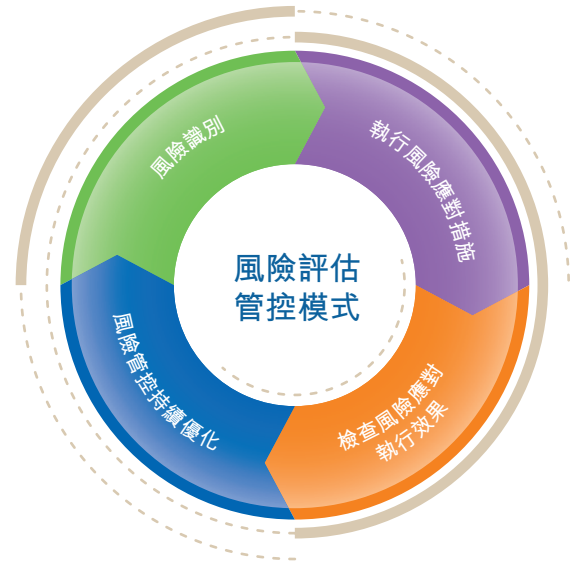
（圖二：風險評估管控模式）

本年度，集團管理層通過對上年度風險評估中識別的管控提升點的落地情況進行跟進，形成持續的「風險評估—風險管控落地—風險管控實施情況的跟進—風險管理系統的持續監測」的循環管控模式，確保重大風險管理薄弱點得到有效改善，以持續提升集團的風險防範與應對能力（詳見圖二：風險評估管控模式）。