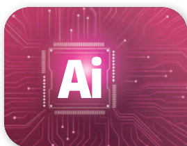
流量預測 及電力調整