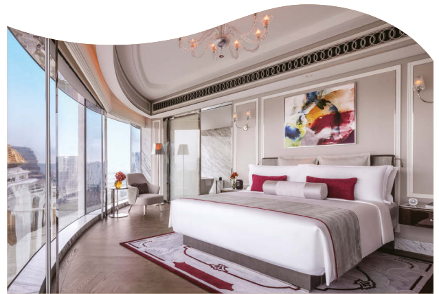
澳門銀河 萊佛士套房