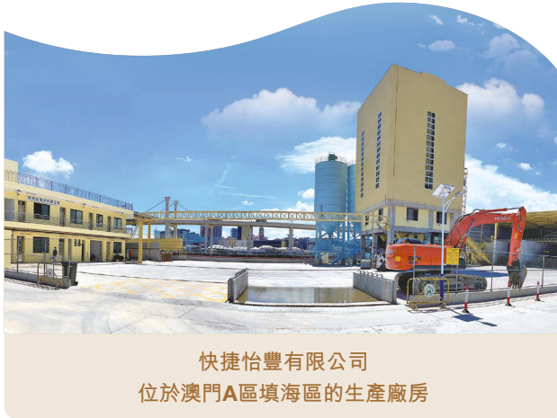
快捷怡豐有限公司 位於澳門A區填海區的生產廠房