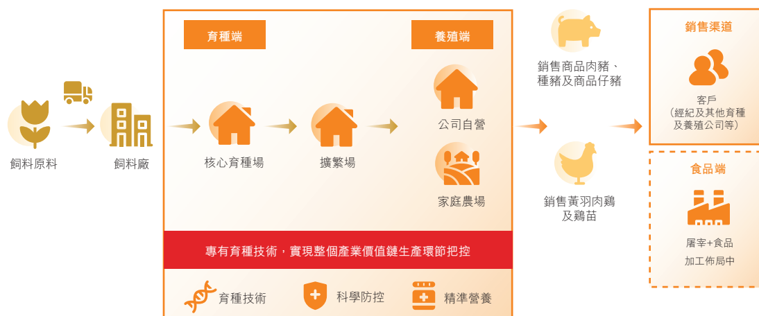
圖註：我們的業務模式