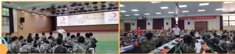
圖註：德康員工培訓

依託該培養機制，我們已建立了一支擁有先進豬群健康管理理念，技術過關，願意深耕農牧行業的青年獸醫團隊。截至2023年末，我們已培養了畜牧行業精英成員共計60餘名，其中包含碩士研究生39名，指導培養高級獸醫師2名，中級獸醫師11名，技術骨幹15名。