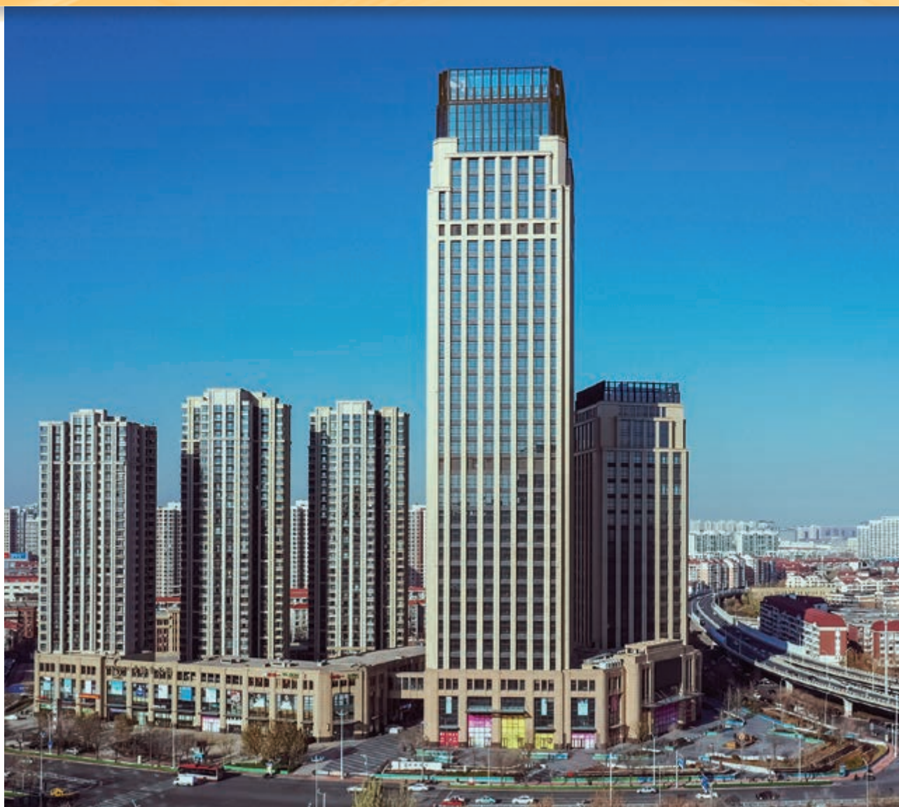
富豪新開門 — 位於天津河東區黃金地段之商業/寫字樓/住宅綜合發展項目