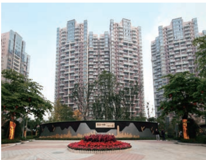
富豪國際新都薈富豪公館(第一期及第二期) — 已落成