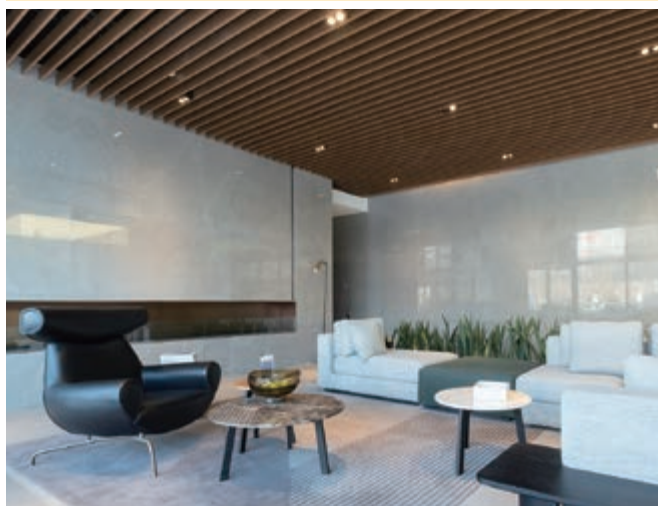
寫字樓大樓之大堂