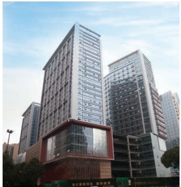
富豪新都酒店及商業/寫字樓大樓 — 建築及外牆工程已竣工