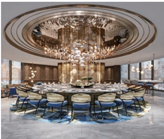
富豪新都酒店之私人飯廳(*)