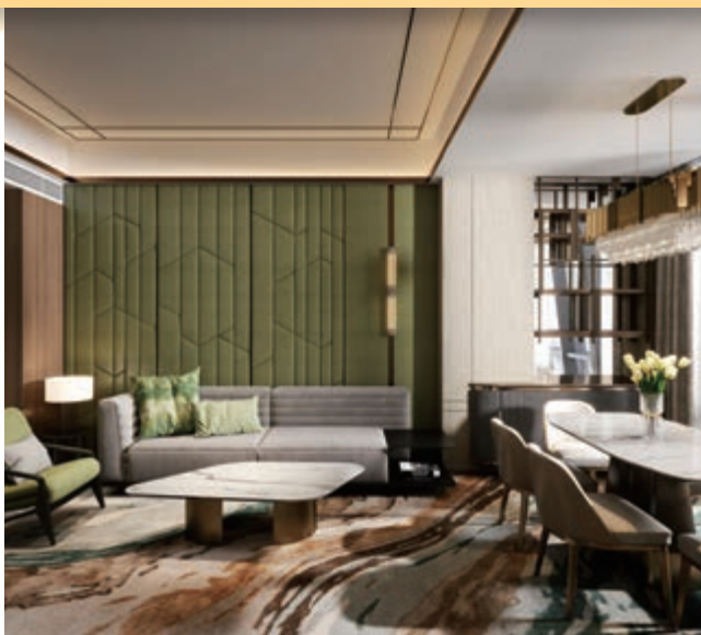
富豪新都酒店之客房套房(*)