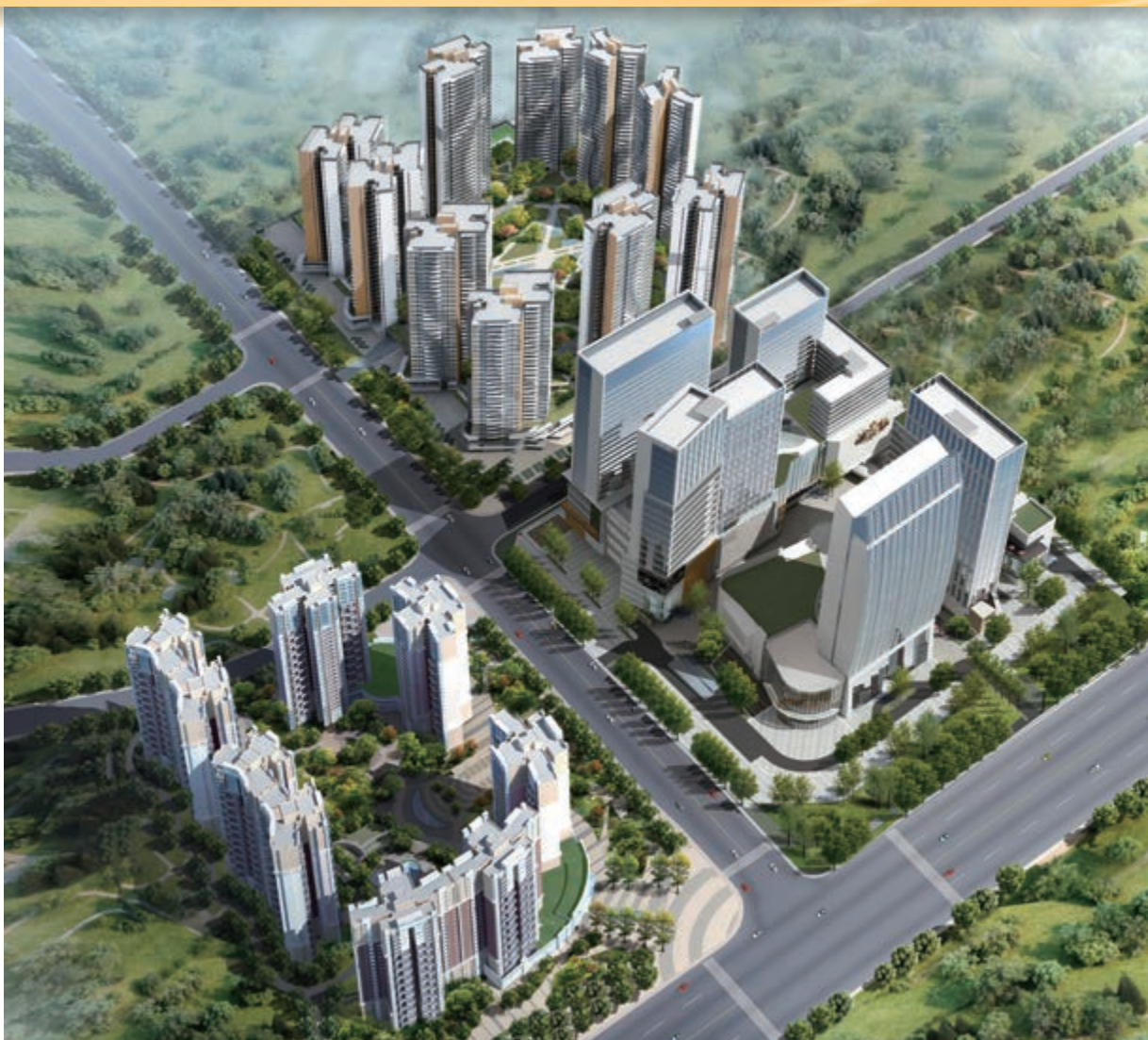
富豪國際新都薈 — 位於四川成都新都區之住宅/商業/寫字樓/酒店綜合發展項目(*)