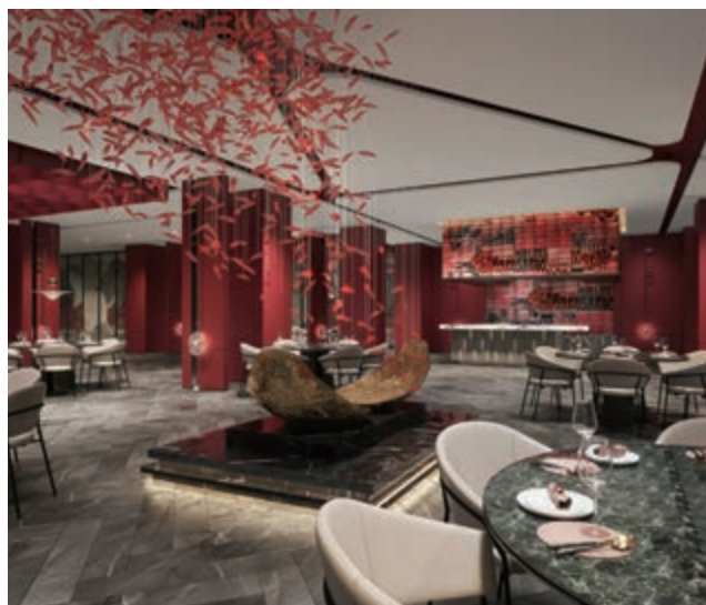
富豪新都酒店之中菜廳(*)