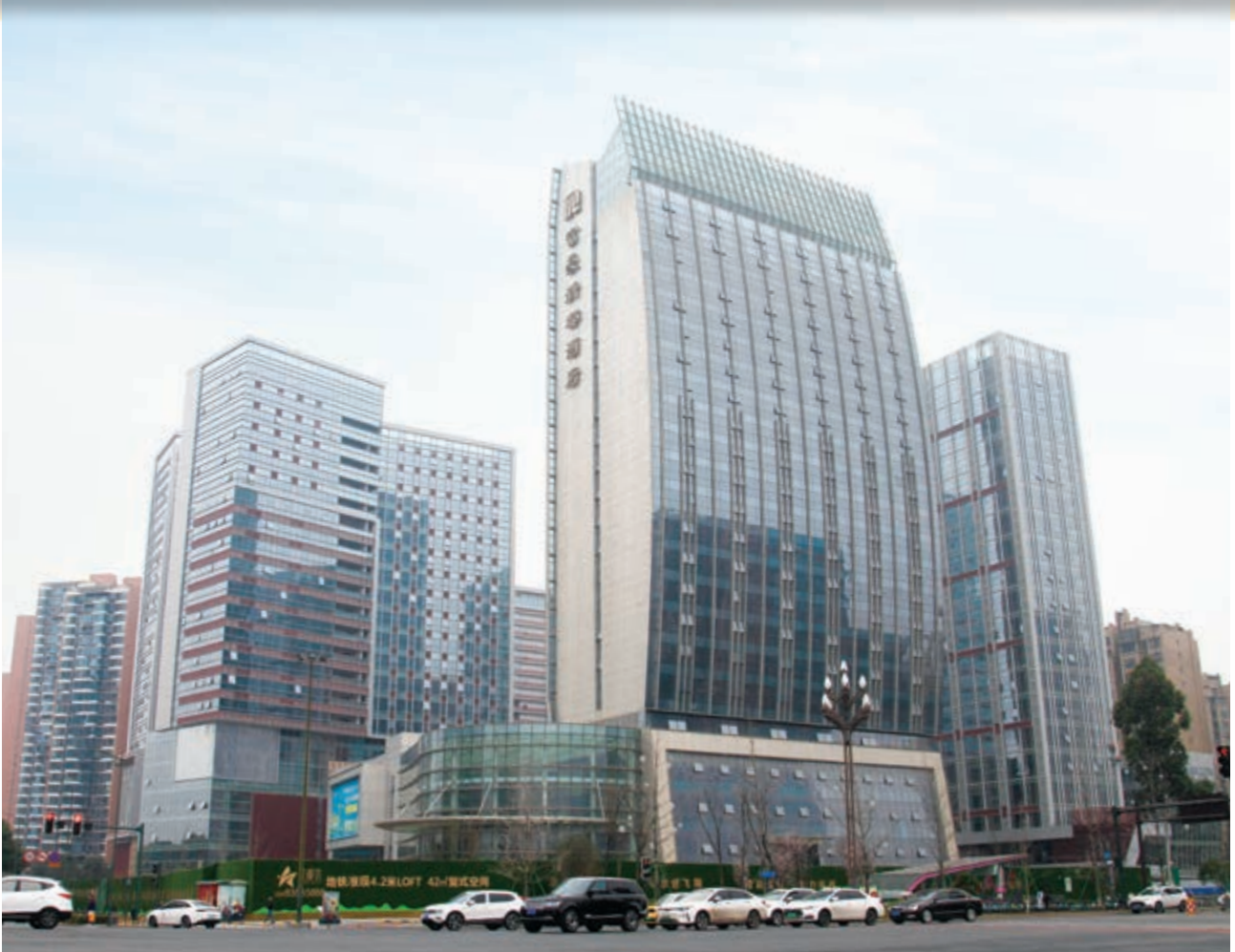
富豪國際新都薈 — 富豪新都酒店及商業/寫字樓大樓