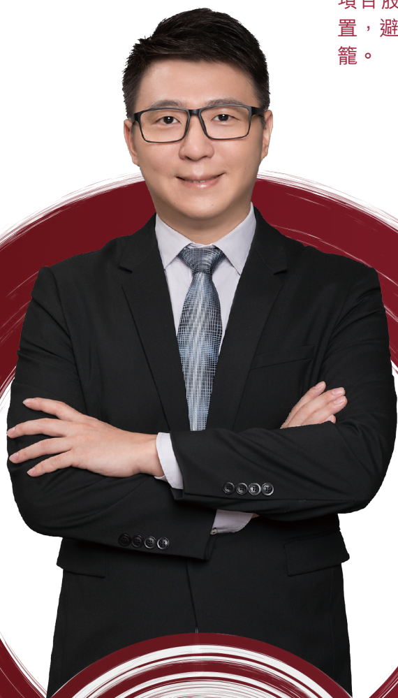
陳思銘先生 董事會主席

為進一步壓降流動性風險，本集團適時出售自持成熟地段帶租物業、盤活閒置資產對外租賃、轉讓廣州市珠江村的舊改項目股權，通過對非核心優質資產的精細化管理及有效處置，避免資金持續投入損耗的同時，創收變現、加速資金回籠。