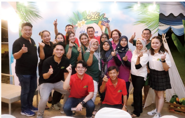
年度晚宴：夏威夷主題答謝晚宴

於2023年5月，我們為僱員成功舉辦了一場難忘的年度晚宴，有來自各分支機構的僱員參加，年度晚宴在關丹一間酒店舉行。