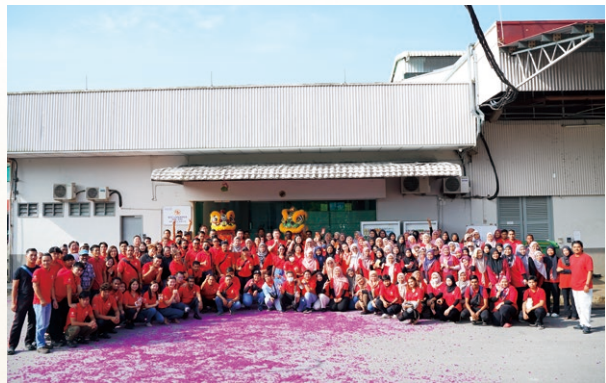
中國春節慶祝活動