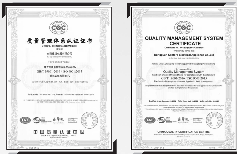
東莞建福取得ISO 9001質量管理體系認證， 有效期由2022年4月18日至2025年5月21日 (自2001年12月起取得)

本集團亦強制要求所有賣家及業務夥伴遵守RoHS指令規定。此外，本集團的生產過程符合當地的環保法規。