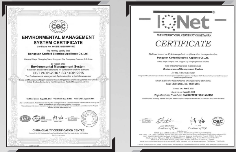
東莞建福取得的ISO 14001環境管理體系認證及IQNet認可證書， 有效期由2021年6月8日至2024年8月9日 (自2018年8月起取得)

本集團位於中國東莞的生產基地已取得ISO 14001：2015標準環境管理體系認證。本集團已制定《環境手冊》，盡量減輕其對環境及天然資源的主要影響，確保遵守環境管理體系。