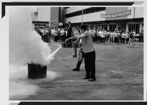
東莞建福舉行消防疏散演練

此外，本集團的政策為維持健康工作團隊、提升健康工作條件，並讓僱員維持健康生活模式。本集團於廠區提供各類體育設施，及持續每年舉辦兩次體育節。本集團每年安排醫生在生產基地為生產員工進行健康檢查。此外，本集團也參與附近社區中心及政府協會舉辦的各種體育賽事及休閒活動。