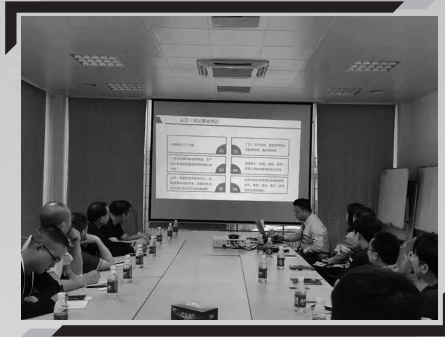
員工事故應變培訓