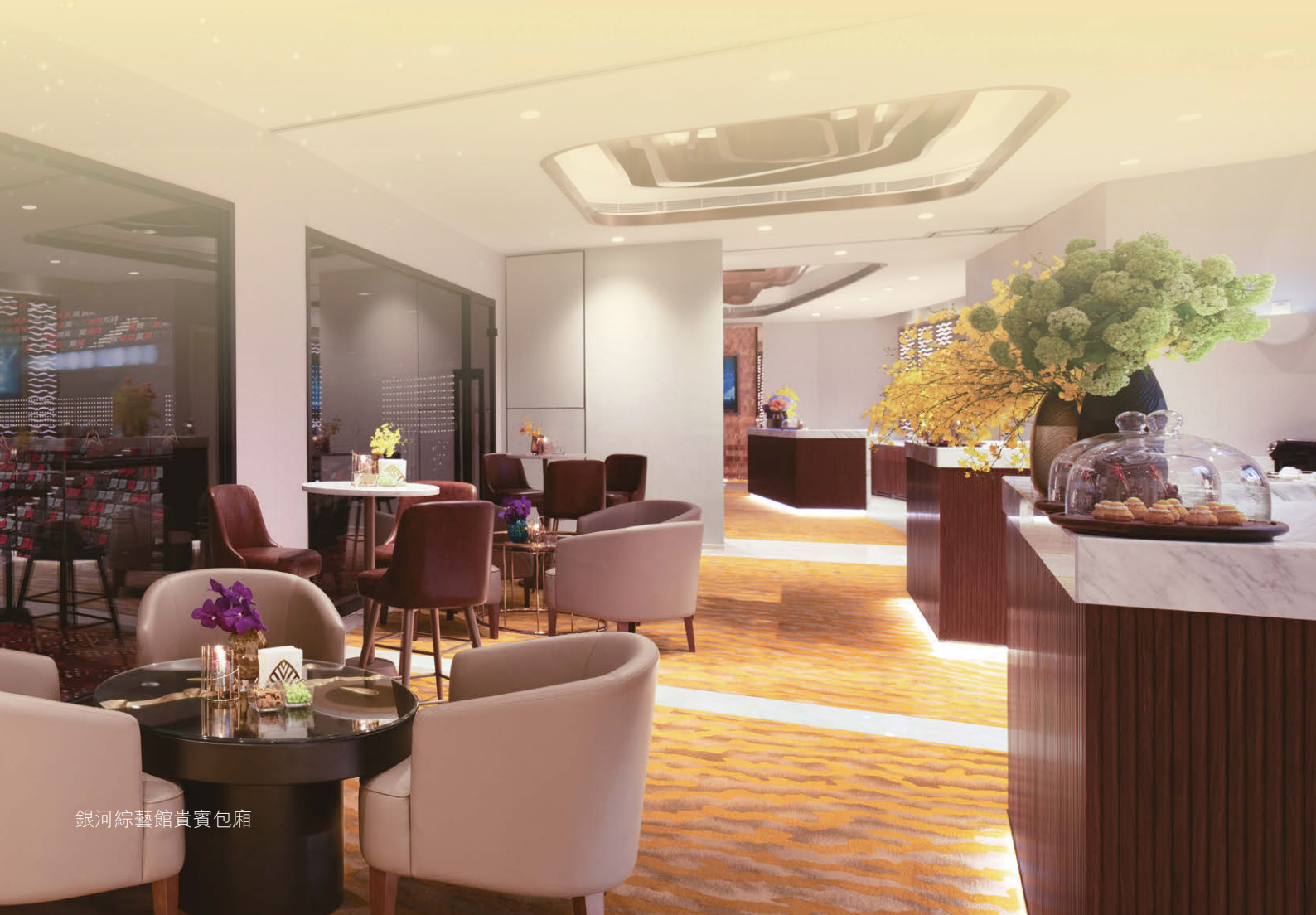
銀河綜藝館貴賓包廂