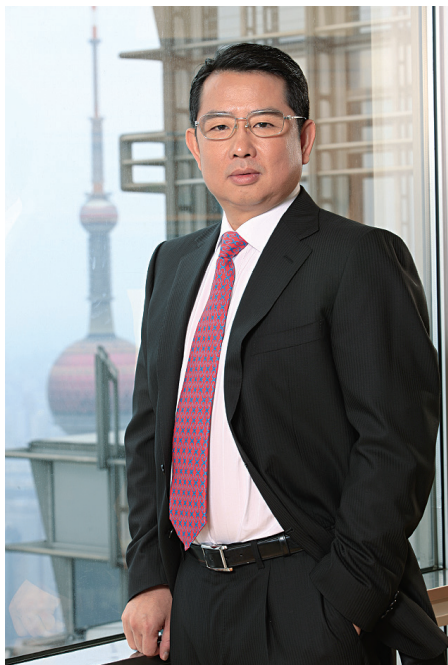
宏信建設發展有限公司 董事會主席及非執行董事