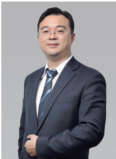
宏信建設發展有限公司 執行董事及首席執行官