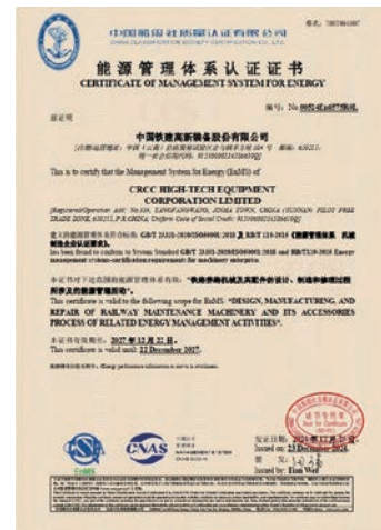
能源管理體系認證證書： GB/T 23331-2020/ISO50001:2018

本公司建立了能源管理體系，完成下發管理手冊、12個程序文件和能源評審、符合性評價、管理評審等相關報告，通過了認證機構審核並於二零二四年十二月二十三日取得認證證書。