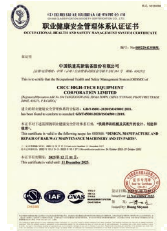
GB/T45001-2020/ISO45001: 2018職業健康安全 管理體系證書

鑒於本公司的業務特性，僱員的職業健康與安全被視為重要社會責任。本公司二零一三年通過《職業健康安全管理體系》GB/T28001-2011認證，本公司亦持續改進、完善該體系。本公司二零一九年按照《職業健康安全管理體系》ISO45001-2018新標準進行換版改進，並通過外部認證機構換版認證審核，二零二零年取得了《職業健康安全管理體系》GB/T45001-2020/ISO145001：2018認證證書，二零二二年通過了再認證審核，二零二四年持續保持了認證證書。本公司已制定多項經國內認證的符合國際標準的職業健康及安全管理條例，實施多項關於安全控制流程與標準的手冊及內部政策，亦要求所有僱員遵守相關條例。