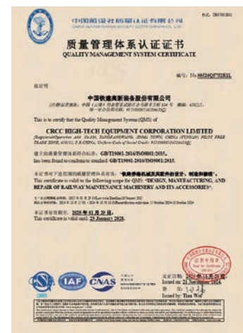
ISO 9001 質量管理體系 認證證書

為充分確保並驗證本公司具備持續提供滿足市場與用戶需求的產品及服務質量保證能力，本公司嚴格按國家體系認證監管要求，每年定期接受資質認可權威機構審查，獲頒發的專業體系證書並保持。為本公司產品准入並參與國內外市場競爭提供有力支撐和保障，增強企業綜合競爭力，推動企業健康、可持續發展。